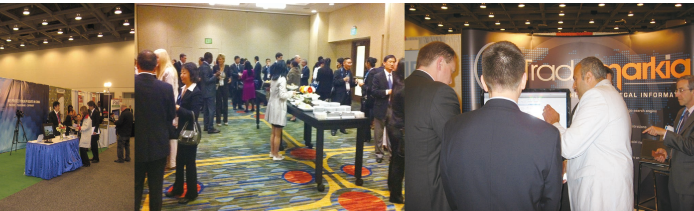
中国接待会在SF Marriot酒店举行。